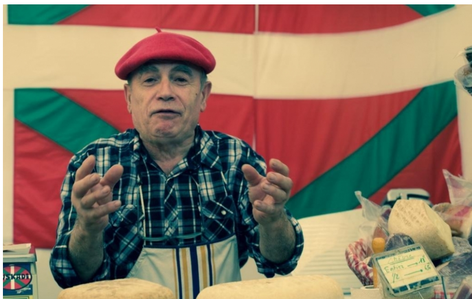
Saint-Cloud. Le salon du terroir qui se déroule à l'hippodrome rassemble 150 exposants.

L e salon du terroir de Rueil-Malmaison (92) attire chaque année 15 000 visiteurs. Sous un vaste chapiteau, à l'hippodrome de Saint-Cloud, s'alignent 150 exposants venus de toute la France. Du 2 au 4 décembre, vous discuterez avec des producteurs de vins, de Champagne, de condiments, de nougats, chocolat, fruits confits, macarons et pains d'épices. Vous pourrez goûter aux huîtres de Normandie, aux produits du Périgord ou encore du Pays basque.